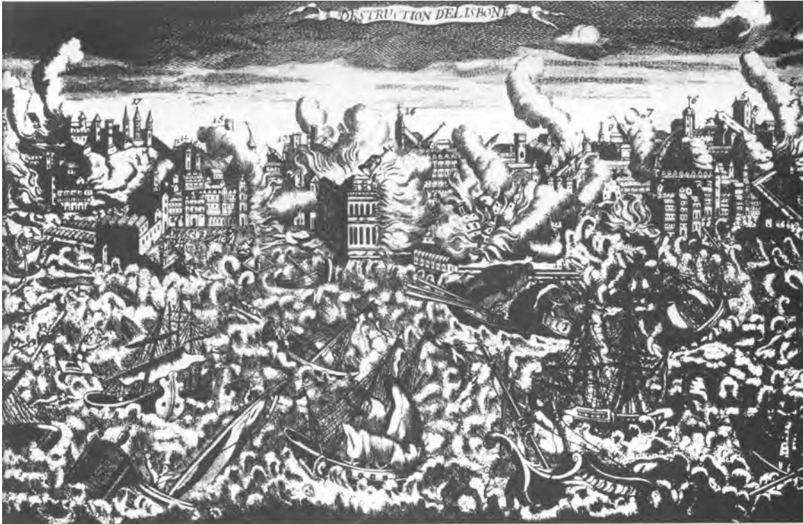
Figura nº 1:

(A cidade de Lisboa durante o Terramoto de 1755, em gravura da época in Joaquim Veríssimo Serrão, História de Portugal , vol. VI. O despotismo iluminado (1750-1807) , 5ª edição, Lisboa, Editora Verbo, 1996, entre p.32 e 33)